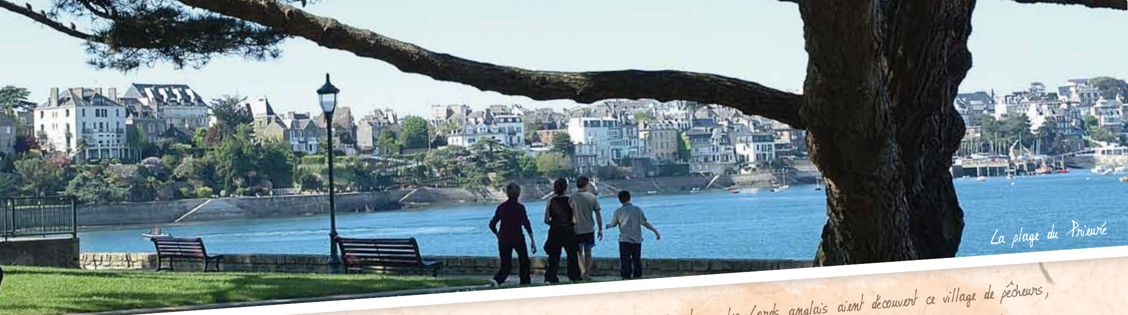
La plage du Prieuré