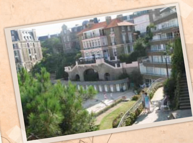
La plage de l'écluse