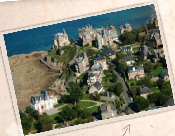
La Pointe de la Malouine

Festivals, concerts, expositions : son programme d'animations est époustouffant d'audace et de qualité.