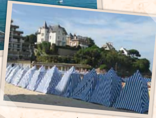
La plage de l'Ecluse