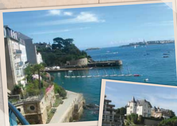
Le Bec de la Vallee...